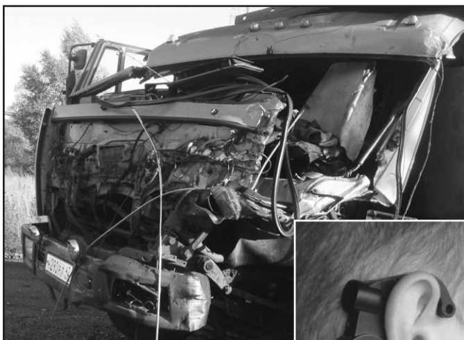
Вот во что превратился КАМАЗ 65115 после аварии