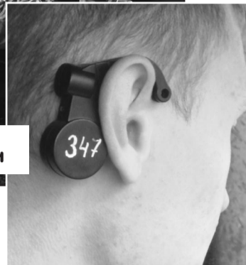
«Антисон» не позволит уснуть за рулем